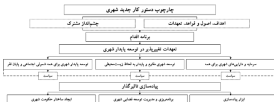
شکل ۳. چهارچوب بیانیه دستور کار جدید شهری

امن، انعطاف‌پذیر و پایدار کمک می‌کند (دستور کار جدید شهری، ۲۰۱۷). به منظور تحقق دستور کار توجه کشورها به این پنج محور اساسی ضروری است (نشست تخصصی بررسی دستور کار جدید شهری هیئت‌ات III، http://unhabitat.org.ir ): سیاست ملی شهری؛ قانونگذاری شهری و قوانین و مقررات؛ برنامه‌ریزی و طراحی شهری؛ اقتصاد شهری و تأمین مالی شهرداری؛ اجرای کالبدی محلی. دستور کار به طور کلی دارای دو بخش بیانیه کیتو و برنامه اجرایی است که در بخش اول به چشم‌اندازی مشترک به همراه اصول و تعهدات کشورها را ترسیم کرده و در بخش دوم به تبیین تعهدات دگرگون‌ساز، اجرای مؤثر و بازبینی می‌پردازد. این تعهدات شامل مسائلی همچون توسعه پایدار شهری در حوزه اجتماعی و پایان فقر