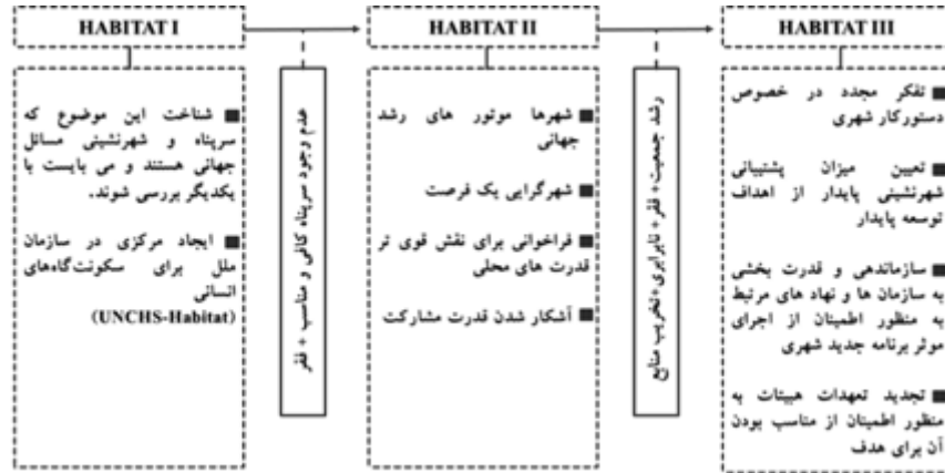
شکل ۴. خروجی های هییتات I، II و III

مساله مسکن، در بعد وسیع‌تر از شهر مورد بررسی قرار گرفته‌است. در روند حرکت به سمت هییتات III،