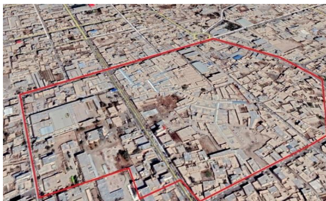
شکل (۴): فضاهای باز و متراکم شهر زابل/ بازار مرکزی شهر و مصلى المهدى شهر به عنوان محل اسکان اضطرارى روباز در بافت متراکم مسکونی

ریخت شناسی شهر: تحلیل وضعیت بلند مرتبه سازی، عرض معابر کم و فضاها باز گسترده در سطح شهر بسیار کم می باشد و ساختار معابر شهر شطرنجی و تراکم ساختار مسکونی در سطح شهر و محلات به متراکم نیمه فشرده می باشد. کنترل فضاهای راهبردی - پدافندی (دسترسی، خدماتی، اسکان ایمن) و محیطی که قبل از بحران، حین بحران و بعد از بحران ضروری می باشد. مشکل یابی در موضوع پدافند غیرعامل فضاهای شهری به عنوان اولین موضوع مطرح می باشد. و آسیب شناسی فضایی مبتنی بر ساختار کالبدی و بافت اجتماعی در پیاده سازی و به کارگیری راهبردهای پدافند غیرعامل ضروری می باشد. مشکل گشایی از طریق سیاست گذاری مناسب و افزایش ضریب پایداری زیست در مکان و فضاهای شهری امکان پذیر می باشد. تدوین چارچوب سازمان فضایی شهر مبتنی بر اصول پدافند غیرعامل/مدیریت بحران (تفکیک سازمان) و راهکارهای اجرای اصل اختفاء؛ پوشش و استتار در ساختار شهر می باشد.