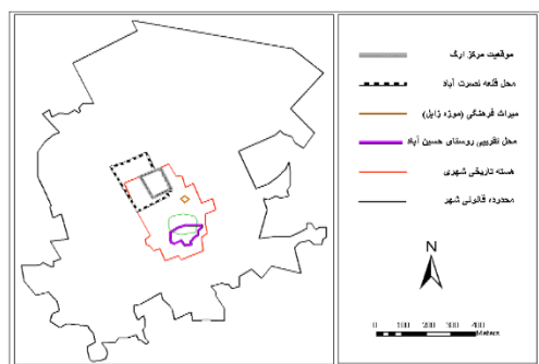
نقشه (۱): محدوده شهر زابل

مساحت شهر زابل در داخل محدوده مصوب طرح تفصیلی بالغ بر ۲۰۸۴/۵۲ هکتار (۱۳۲۸٫۸ هکتار اراضی خالص و ۷۵۵٫۷ هکتار اراضی ناخالص شهری) است، بر اساس سرشماری سال ۱۳۹۵ جمعیت شهر زابل ۱۳۸۲۷۴ نفر بوده است. ارتفاع متوسط این شهر ۴۷۵ متر از سطح دریا بوده و در جلگه‌ای وسیع و هموار واقع شده که اطراف آن را اراضی مسطح فرا گرفته است (ابراهیم‌زاده، ۱۳۸۸: ۴۱؛ مهندسین مشاور طاش، ۱۳۸۵ و سالاری سردری و کیانی، ۱۳۸۸: ۳).