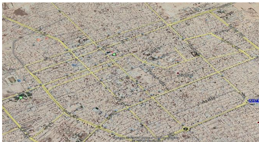
شکل (۳): ساختار شطرنجی شهر زابل (شبکه ارتباطی پرتردد بخش مرکزی) و انباشت، تراکم جمعیت و فعالیت (میزان انباشت و تراکم جمعیت و فعالیت در یک مکان): بازار/مراکز فعالیت های اقتصادی، معابر (شبکه ارتباطی دسترسی درجه یک، درجه دو و درجه سه)، مکان های عمومی، خدماتی، تمرکز

ارزش مختلفی را به منظور تحقق پدافند غیرعامل کسب می نمایند.