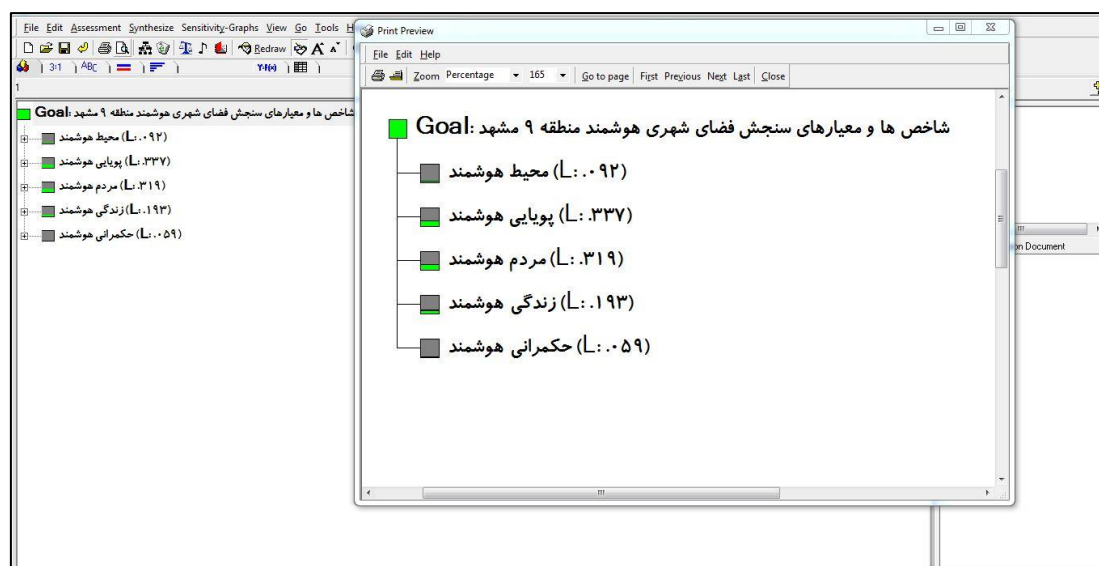
شکل ۱. امتیاز شاخص‌های فضای شهری هوشمند

با توجه به امتیاز کارشناسان به معیارهای کلی و زیر معیارهای انتخابی برای اولویت‌بندی شاخص‌های مؤثر در تأثیر هوشمند سازی با تأکید بر زیست پذیری شهرها در منطقه ۹ شهرداری مشهد، پس از به دست آمدن امتیازها میانگین امتیاز کارشناسان وارد نرم‌افزار می‌شود و معیارها نسبت به هم امتیازدهی می‌شوند. امتیاز معیارهای به دست آمده بر اساس نظرات کارشناسان به شرح شکل (۱ و ۲) می‌باشد. همچنین جدول ۳، اولویت‌بندی شاخص‌های مؤثر در هوشمندسازی منطقه ۹ شهر مشهد را نشان می‌دهد.