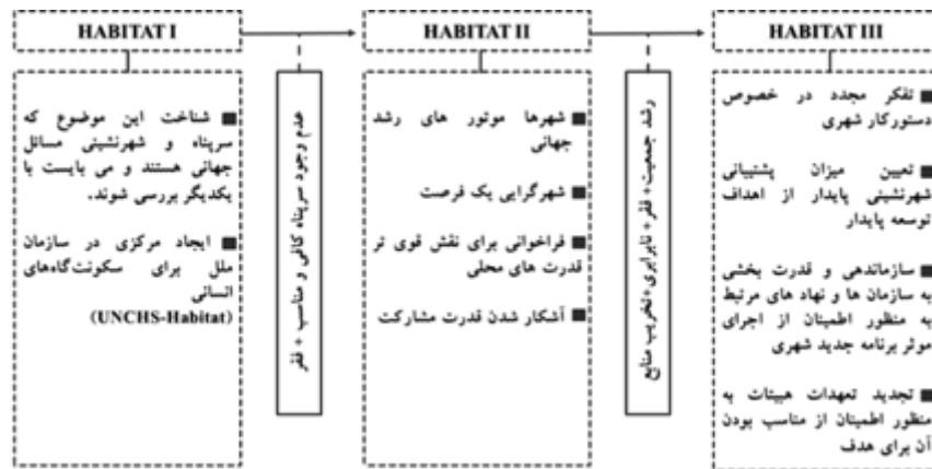
شکل ۴. خروجی های هیئات I، II و III

مساله مسکن، در بعد وسیع‌تر از شهر مورد بررسی قرار گرفته است. در روند حرکت به سمت هیئات III،