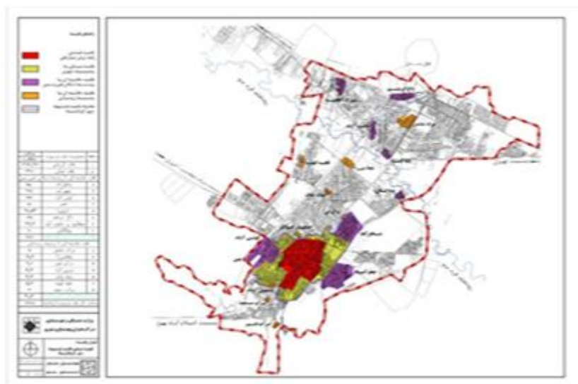
شکل ۲. موقعیت قرارگیری بافت های فرسوده شهر کرمانشاه

در برنامه ریزی استراتژیک چندین مدل جهت دستیابی به توسعه پایدار شهری وجود دارد نظیر مدل برائسون، دیوید، دیکسون، گلکار و ...، در این پژوهش با بهره جستن از این مدلها، فرایند برنامه ریزی استراتژیک برای بازآفرینی بافتهای فرسوده شهر کرمانشاه صورت گرفت. جهت انجام پژوهش مطالعه منابع و اسناد برنامه ریزی استراتژیک و استراتژیهای توسعه شهری و اسناد فرادست توسعه شهری کرمانشاه (طرح آمایش، طرح جامع و تفصیلی، طرح توانمندسازی، طرح بهسازی و نوسازی و ...) مورد بررسی قرار گرفت.