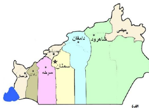
شکل ۲. الف) نقشه استان سمنان و شهر دامغان ب) محل منطقه ویژه اقتصادی دامغان