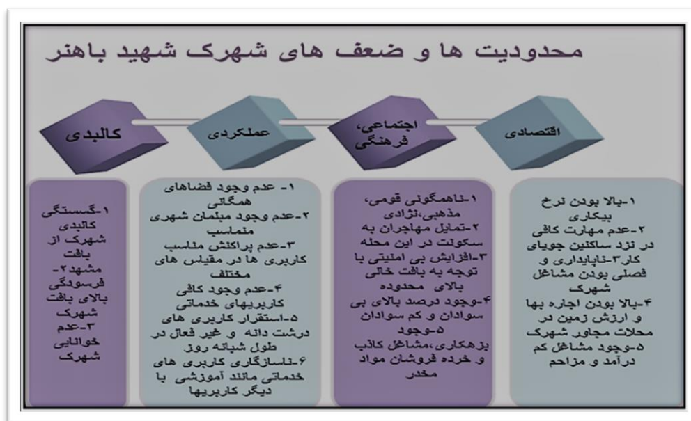
شکل ۲- محدودیت ها و ضعف های شهرک شهید باهنر

عدم توجه به پتانسیل هایی چون پیشینه روستایی شهرک شهید باهنر و امکان فرصت ایجاد شغل برای ساکنین به صورت کشاورزی شهری و طراحی فضای گردشگری در ورودی جاده سرخس به صورت سایت گردشگری -سستی مشهد به شکل بوم گردی های روستایی و حفظ کالبد شهرک به صورت پروژه روستا- شهری در شهرک باهنر و امتیاز نزدیکی این پروژه به حرم امام رضا (ع) و فرودگاه هاشمی نژاد از دیگر کاستی های طرح حاضر در معرفی امکانات و پتانسیل های شهرک شهید باهنر می باشد. طبق تصویر شماره ۳، فرصت ها و پتانسیل های بررسی شده توسط مشاور در طرح تفصیلی شهرک شهید باهنر به صورت کاملاً مختصر و اجمالی و بدون توجه به نادیده گرفته شدن نقش و رسمیت نداشتن شهرک شهید باهنر در طرح جامع مشهد مورد مطالعه قرار گرفته است.