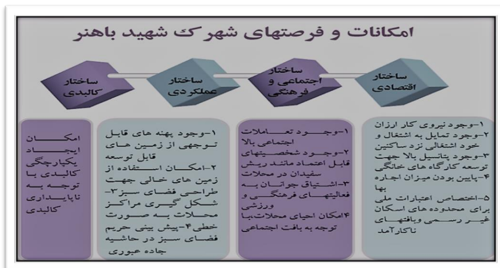
شکل ۳- امکانات و فرصت های شهرک شهید باهنر

عدم توجه به پتانسیل هایی چون پیشینه روستایی شهرک شهید باهنر و امکان فرصت ایجاد شغل برای ساکنین به صورت کشاورزی شهری و طراحی فضای گردشگری در ورودی جاده سرخس به صورت سایت گردشگری -سستی مشهد به شکل بوم گردی های روستایی و حفظ کالبد شهرک به صورت پروژه روستا- شهری در شهرک باهنر و امتیاز نزدیکی این پروژه به حرم امام رضا (ع) و فرودگاه هاشمی نژاد از دیگر کاستی های طرح حاضر در معرفی امکانات و پتانسیل های شهرک شهید باهنر می باشد. طبق تصویر شماره ۳، فرصت ها و پتانسیل های بررسی شده توسط مشاور در طرح تفصیلی شهرک شهید باهنر به صورت کاملاً مختصر و اجمالی و بدون توجه به نادیده گرفته شدن نقش و رسمیت نداشتن شهرک شهید باهنر در طرح جامع مشهد مورد مطالعه قرار گرفته است.