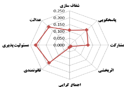
شکل ۳. مقایسه وزن شاخص‌های حکمروایی خوب شهری جدول ۵. وزن شاخص‌های حکمروایی با استفاده از نرم افزار Expert Choice

از آنجایی که شاخص‌های حکمروایی شهری از اهمیت یکسانی برخوردار نمی‌باشند، لذا برای ارزیابی دقیق‌تر لازم است تا اهمیت و یا وزن نسبی هر کدام از آنها مشخص گردد. در این راستا از روش‌های متفاوتی استفاده می‌گردد. در تحقیق حاضر از تحلیل سلسله مراتبی (AHP) برای تعیین وزن شاخص‌ها استفاده شده است. به منظور وزن دهی به شاخص‌های پیشنهادی از نظرات کارشناسان مرتبط با حوزه تخصصی بهره‌گیری گردید. وزن به دست آمده از شاخص‌ها در جدول ۵ نشان می‌دهد که شاخص مسئولیت پذیری (با وزن شاخص ۰/۲۱۶) و عدالت (با وزن شاخص ۰/۱۸۶) به ترتیب بیشترین وزن را به خود اختصاص داده‌اند و کمترین امتیاز برای شاخص اثر بخشی با میزان ۰/۰۱۴ می‌باشد. جدول (۳).