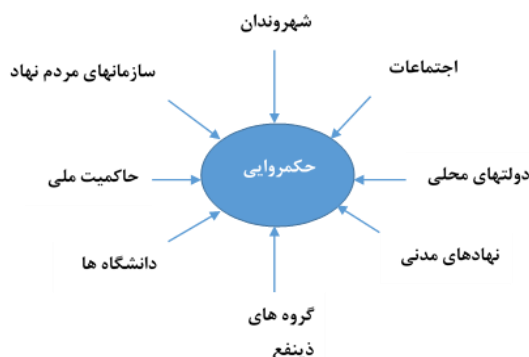
شکل ۱. ذینفعان و مشارکت‌کنندگان اصلی در الگوی حکروایی شهری

گران می‌توان به سازمان‌های جامعه مدنی (CSOs)، سازمان‌های جامعه محور (CBOs)، گروه‌های عقیدتی و همچنین کسب‌وکارهای خصوصی رسمی و غیر رسمی اشاره نمود.