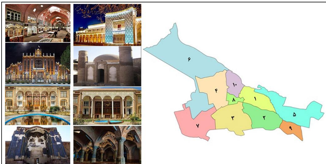
شکل ۱. موقعیت جغرافیای حوزه شهرداری فرهنگی - تاریخی منطقه ۸ تبریز و عکس بناهای تاریخی آن

دلیل قدمت زیاد، تجمع مراکز تجاری و تفریحی و کارگاه‌های تولیدی، استانداری، اداره دارایی و مالیات، فرمانداری شهرستان تبریز، بانک ملی مرکزی استان و همچنین وجود شعبات مختلف بانک‌ها و سایر دفاتر خدماتی، است که منجر به تردد زیاد شهروندان از تبریز و سایر شهرستان‌های استان به این منطقه می‌شود بافت قدیمی شهر تبریز که در حوزه شهرداری فرهنگی - تاریخی منطقه ۸ تبریز قرار دارد، شامل هفت محله اصلی بوده که عبارت‌اند از: بازار، شهناز، مقصودیه، دانشسرا، منصور، قره باغ-بالاحمام و تپلی باغ-دمشقیه. مهمترین چالش‌های این منطقه عبارت‌اند از: ترافیک سنگین، بناهای فرسوده، سختی خدمات رسانی، معابر قدیم که به صورت ارگانیک و غیر فنی ساخته شده‌اند، کمبود شدید فضای سبز، و غیره. شاخص‌ترین بناهای تاریخی قرار گرفته در این منطقه عبارت‌اند از: بازار سرپوشیده تبریز به عنوان بزرگ‌ترین بنای سرپوشیده جهان که در فهرست میراث جهانی یونسکو ثبت شده است. مسجد جامع تبریز، مسجد ۶۳ ستون، مسجد چهار منار، خانه مشروطه، ساختمان بانک ملی، خانه حیدر زاده، خانه قدکی، موزه مشروطه، پیاده‌راه تربیت، مسجد کبود، عمارت شهرداری، کاخ استانداری بخشی از این آثار تاریخی هستند که در محدوده حوزه شهرداری فرهنگی - تاریخی منطقه ۸ تبریز قرار دارند (شکل ۱).