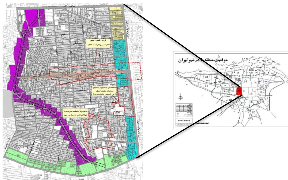
شکل ۱: موقعیت جغرافیایی منطقه ۱۰ شهر تهران