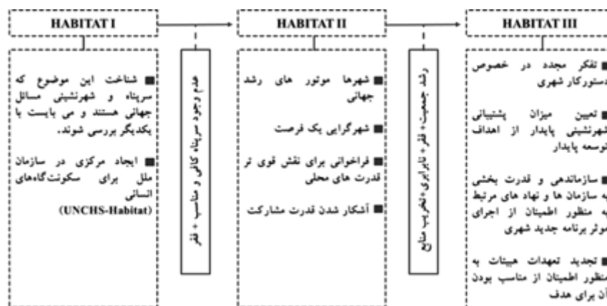
شکل ۴. خروجی‌های هیئات I، II و III

مساله مسکن، در بعد وسیع‌تر از شهر مورد بررسی قرار گرفته است. در روند حرکت به سمت هیئات III،