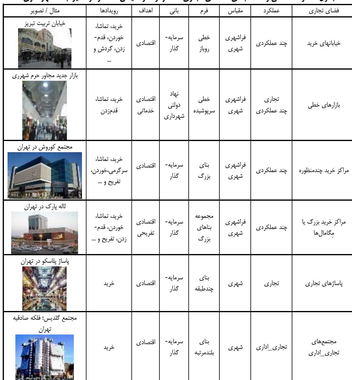
جدول ۱: گونه شناسی و دسته بندی فضاهای تجاری معاصر از نظر مقیاس، عملکرد و سایر ابعاد شهرسازی

پیش از این در ایران، تنها فضاهای تجاری محدود و کوچک ساخته و به آنها پاساژ گفته می شد، اما در ادامه با رشد مبادلات تجاری و نیاز فعالان اقتصادی به فضای اداری، ساخت مراکز تجاری و اداری آغاز شد. بعد از آن به تدریج کاربری های دیگر مانند رستوران، شهربازی و سینما به این مراکز اضافه شد و نام آنها به مجتمع های تجاری و تفریحی تغییر یافت؛ به عبارت دیگر در دهه های اخیر، در مراکز خرید «چرخشی فرهنگی» رخ داده است؛ به این معنا که این مراکز تنها کارکرد اقتصادی و رفع مایحتاج روزمره ندارند، بلکه کارکردی فرهنگی و اجتماعی نیز یافته اند. معماری نیز همگام با تغییر نیاز افراد جامعه دچار تحولاتی شده است (حسین آبادی، ۱۳۸۷). تحولات بازار در گذر زمان، منجر به شکل گیری گونه های مختلفی از مراکز خرید شده است؛ نظیر: پاساژها، مراکز خرید، مال ها، مال های چندمنظوره (مگامال)، مراکز خرید تک محصوله، مرکز خرید جشنواره ای، مرکز قدرت و مرکز سبک زندگی و ... از سویی دیگر در پژوهش ها و مطالعات این حوزه نیز با توجه به مقیاس، ویژگی ها و شعاع عملکردی دسته بندی های متعددی از گونه های مراکز خرید آورده شده است. با توجه به این موارد مراکز خرید معاصر را می توان در قالب جدول ۱ (Tab1) گونه بندی نمود.