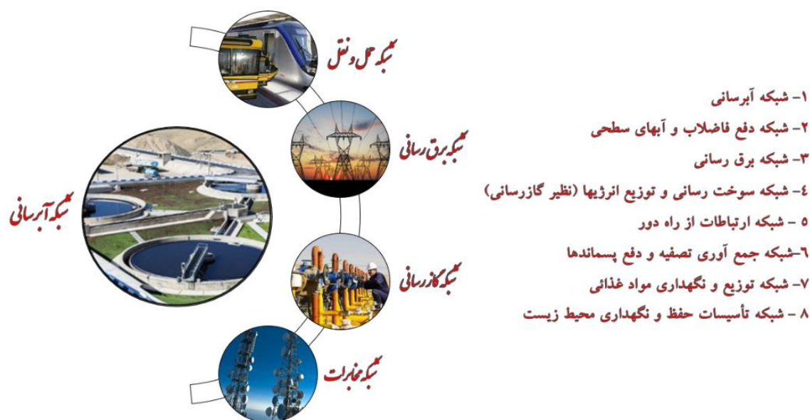
شکل ۲. عمده عناصری که معمولاً در قالب شبکه، تأسیسات و تجهیزات زیر بنایی را تشکیل می دهند (بهزادفر، ۱۳۹۲)

زیرساخت هوشمند توانایی تأثیرگذاری و هدایت استفاده، نگهداری و پشتیبانی خود را با پاسخگویی هوشمندانه به تغییرات محیط خود دارد (CSIC, 2016). زیرساختهای انرژی (برق و گاز)، آب، حمل و نقل و شبکه مخابراتی از مهمترین شریانه های توسعه ای مطرح شده در ادبیات پژوهش، به «زیرساختهای حیاتی» معروف هستند (Pursiainen, 2018; Osei-Kyei et al, 2021)