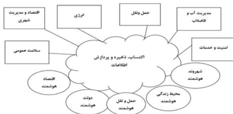
شکل ۴: ارکان و موارد کاربرد متنوع شهرهای هوشمند، (Vijai, P & Bagavathi Sivakumar, P. 2016)

شکل ۴، بیانگر برخی از پایه های شهر هوشمند و کاربردهای آن است که شامل مدیریت آب و فاضلاب نیز است. با اجرای سیستم های هوشمند آب انتظار می رود که استفاده از منابع آب بهبود یابد، فرهنگ جمعی اشاعه صرفه جویی در مصرف آب ظهور یابد و در انتها فرآیند حفاظت از منابع آبی به واسطه اطلاعات مرتبط با صیانت از آب، گسترش یابد. (Yuanyuan, et al. 2017).