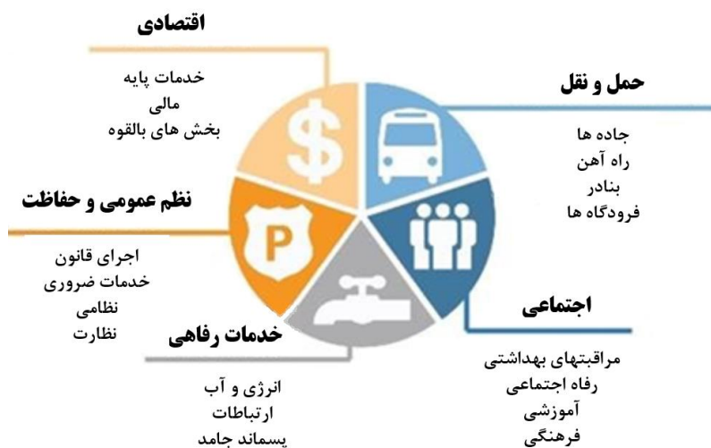
شکل ۳. ملزومات زیرساخت شهرهای هوشمند برای توسعه شهرهای هوشمند

اطلاعات بهتر منجر به درک بهتر رفتار زیرساخت می‌شود. تأثیر این امر منجر به دگرگونی در رویکردهای طراحی و ساخت و همچنین تغییرات گامی در بهبود سلامت و بهره‌وری، کارایی بیشتر در طراحی و عملکرد، جامعه کم‌کربن و برنامه ریزی و مدیریت شهری پایدار خواهد شد (شکل ۳ را ببینید).