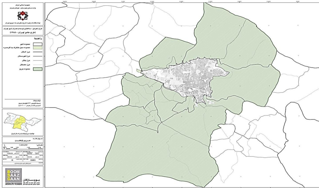
شکل ۱. محدوده مورد مطالعه