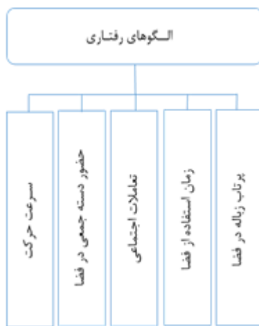
شکل ۴. الگوهای رفتاری مورد بررسی در مقایسه تطبیقی بین دو معبر

هم متفاوت بوده و هر کدام عملکردهای متفاوتی را دارند انتخاب و مورد تحلیل قرار گرفته است. در ذیل مقایسه ای تطبیقی بین رفتارهای ۵ گانه شهروندان و استفاده کنندگان از این فضاها مورد بررسی قرار گرفته است. در شکل ۴ رفتارهای پنج گانه شهروندان مشهد در دو فضای متضاد مورد نظر (دو معبر مورد بحث در این تحقیق) بررسی و مورد تحلیل قرار گرفته است. رفتار استفاده کنندگان از این فضاها در ساعات اوج (۱۲-۱۰ و ۲۰-۱۸) صورت گرفته است.