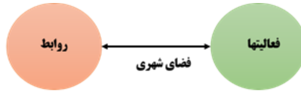
شکل ۲. فضای شهری و ارتباط متقابل میان روابط و فعالیت ها