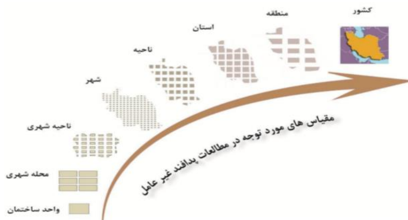
شکل (۲): مقیاس های مواجهه ی بدافند غیرعامل و مدیریت بحران ها

شناسایی اراضی و مکانیابی بیمارستان های صحرایی در برنامه ریزی های پیش از وقوع بحران و آماده